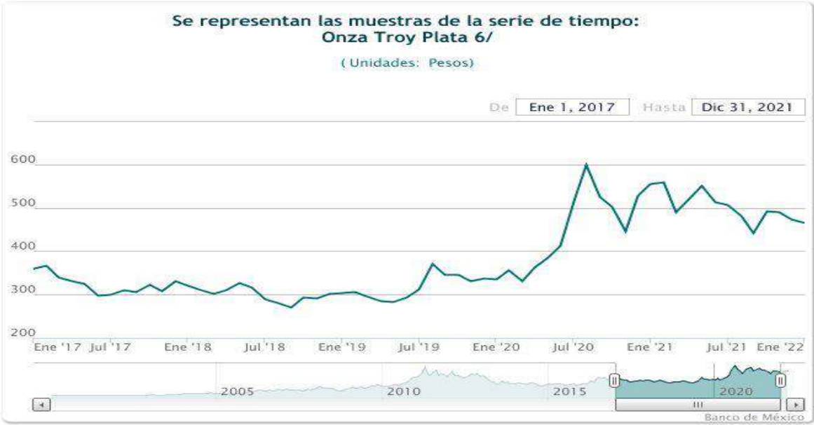
Grafica 5.1 Cotización plata