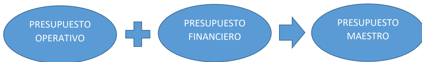
Figura 3.1 Presupuesto Maestro, según (López Alcantara & Gómez Agundiz, 2019)